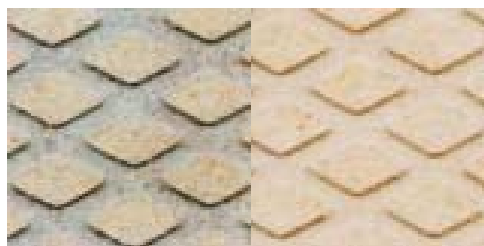
verwittert – gereinigt

DECKSBELAG-CLEANER ist ein wirkungsvoller Reiniger für tiefsitzende Verschmutzungen auf Anti-Rutsch-Belägen von Schiffsdecks. Die Beläge wie z.B. Treadmaster oder TBS sind in der Regel auf Polyurethanbasis und sorgen für eine Rutschsicherheit durch ein eingebundenes Granulat oder eine strukturierte Oberfläche. Verwitterung und Verschmutzung machen diese früher oder später unansehnlich. Eine Reinigung stellt für den Eigner oft ein Problem dar, denn es wird ein Spezial-Reiniger benötigt, der den Kunststoff-Belag und den Kleber nicht angreift und dennoch den Schmutzorentief beseitigt. Durch die Entwicklung des DECKSBELAG-CLEANER erzielt man bei der Reinigung des Decks jetzt ein so wirkungsvolles Ergebnis, dass von einem neuwertigen Erscheinungsbild gesprochen werden kann. Seine gute Eindringkraft entfernt sogar leichte Rostspuren wie z.B. im Bereich des Ankerspills.