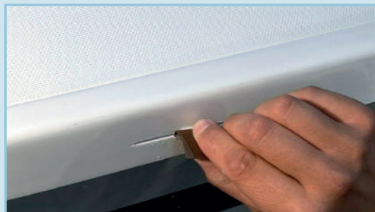
Schleifen der Schadensstelle