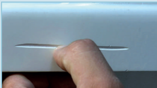
Prüfen der Schadensstelle

Die in der Regel kleine und schmale Schadensstelle muss zunächst weiter geöffnet und V-förmig vertieft werden. Durch die Schleifarbeit werden alle Schmutz- und Fettrückstände entfernt und eine spätere gute Anhaftung der Reparaturmasse zum Untergrund wird erzielt. Im Anschluss werden alle Staubrückstände z. B. mit einem Staubbündetuch entfernt. Die Reparaturstelle wird an den vier Flankenseiten in einem Abstand von ca. 1 mm zur Schadensstelle mit einem dünnen Kleband abgeklebt.