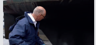
WINTERLAGER TEIL 1

NEUES VIDEO MIT DOCTOR BOAT AUF YACHTCARE.DE